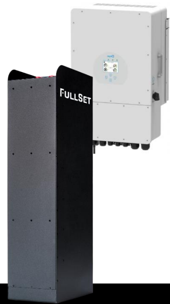
FullSet Pro 14.10

Energia jest dostępna zawsze wtedy, kiedy jej potrzebujesz: wieczorem, w nocy, w pochmurny dzień czy w przypadku awarii sieci. Możesz magazynować energię wyprodukowaną zarówno z instalacji fotowoltaicznej, jak i z sieci.